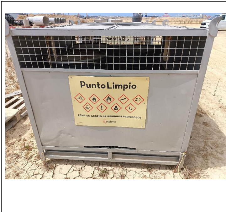
DA: Directora ambiental VA: Vigilante ambiental